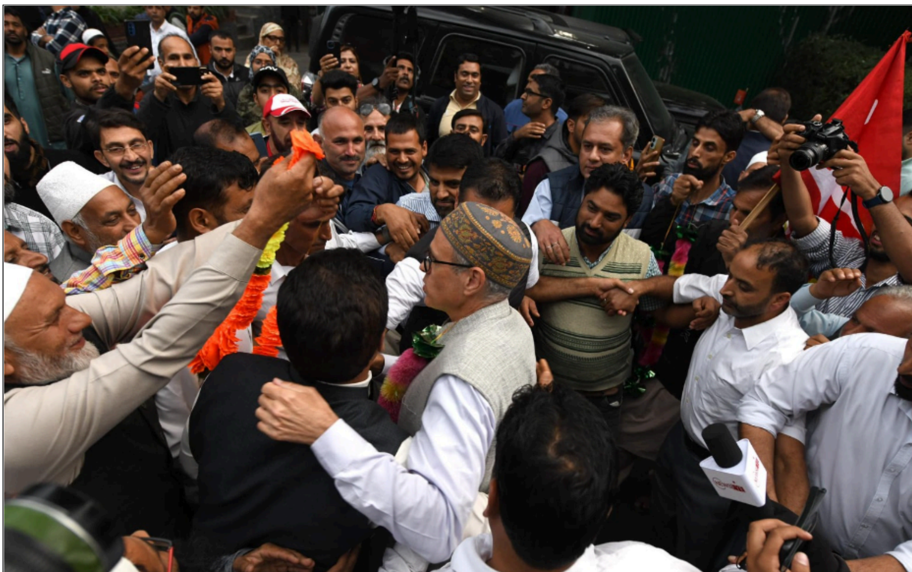
জয়ৰ পিছতে সমৰ্থকসকলৰ সৈতে এনেদৰে দেখা গ'ল নেশ্যনেল কনফাৰেন্সৰ ওমৰ আব্দুল্লাক, কাশ্মীৰত মঙলবাৰে

দিয়ে। হাৰিয়ানাৰ আমাৰ পৰা বিজয় কাঢ়ি লোৱা হৈছে। ফলাফল পৰিৱৰ্তনৰ বিচৰা মানুহৰ অনুভূতিৰ বিৰুদ্ধে। ইপিনে সুপ্ৰিয়া শ্ৰীনেটে কয় যে জম্মু-কাশ্মীৰত ইণ্ডিয়াৰ বৃহৎ বিজয় আৰু বিজেপিৰ পৰাজয় হৈছে। দেশৰ এখন ৰাজ্যক বিজেপিয়ে কৰি অহা অন্যায়ৰ বিৰুদ্ধে ৰাইজে গণতান্ত্ৰিক উপায়েৰে প্ৰতিশোধ লৈছে। ইয়াৰ বাবে সকলো লোকক ধন্যবাদ। হাৰিয়ানাৰ ফলাফল আশাৰ বিপৰীত। মই গৌৰৱান্বিত যে কংগ্ৰেছ দলে কৃষক, সৈনিক, যুৱ আৰু মল্লযোদ্ধাসকলৰ বিষয়ক লৈ নিৰ্বাচনত প্ৰতিদ্বন্দিতা কৰিছিল। আমি এই বিষয়বোৰ শক্তিশালী ভাৱে উত্থাপন কৰি যাম। উল্লেখ্য যে আজি পুৱা ১০ বজালৈকে কংগ্ৰেছ দল আগবাঢ়ি আছিল যদিও পিছত সকলো ওলোটাই হৈ পৰে।