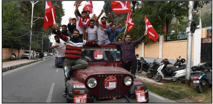
বিজেপিৰ মুখ্য কাৰ্যালয়ত প্ৰধানমন্ত্ৰী মোদী-নাড্ডা, তলৰ ফটোত কাশ্মীৰৰ দৃশ্য

চণ্ডীগড়, ৮ অক্টোবৰঃ ফলাফলৰ পূৰ্বে বিভিন্ন সংস্থাই প্ৰকাশ কৰা এগজিট প'লক পুনৰ এবাৰ ভুল প্ৰমাণিত কৰি হাৰিয়ানাত বিজয়ৰ হেট্ৰিক গঢ়িলে গেৰুৱা বাহিনীয়ে। আজি ঘোষণা হোৱা হাৰিয়ানা বিধানসভা নিৰ্বাচনত ৪৮ খন আসন লাভ কৰি পুনৰ চৰকাৰ গঠন কৰিবলৈ সাজু হৈছে ভাৰতীয় জনতা শেষাংশ ৪ পৃষ্ঠাত