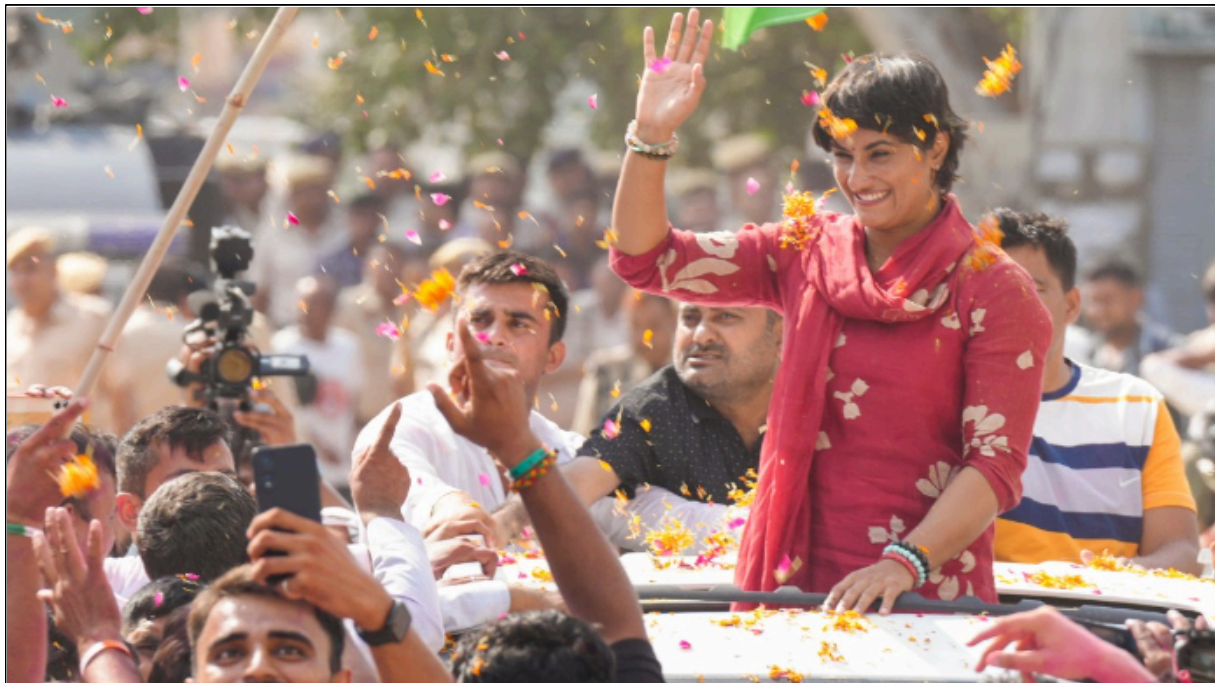
ৰাজনীতিৰ দংগলত প্ৰৱেশ! জয়লাভৰ পিছত সমৰ্থকসকলৰ সৈতে এনেদৰে দেখা গ'ল বিনেশ ফ'গাটক

নতুন দিল্লী, ৮ অক্টোবৰঃ অৱসৰ ঘোষণা কৰিছে অলিম্পিকৰ বাবে যোগ্যতা অৰ্জন কৰা প্ৰথমগৰাকী ভাৰতীয় মহিলা জিমনাষ্ট দীপা কৰ্মকাৰে। ছ'চিয়েল মিডিয়াযোগে আঘাতৰ বাবে অৱসৰ গ্ৰহণৰ কথা ঘোষণা কৰে খেলুৱৈগৰাকীয়ে। এক পোষ্টত তেওঁ কয়, 'বহু চিন্তা আৰু বিচাৰ-বিবেচনাৰ অন্তত মই প্ৰতিযোগিতামূলক জিমনাষ্টিকছৰ পৰা অৱসৰ ল'বলৈ সিদ্ধান্ত লৈছো। এই সিদ্ধান্ত সহজ নহয়। কিন্তু মই ভাবো যে এই সিদ্ধান্তৰ বাবে এয়াই সঠিক সময়।' উল্লেখ্য যে ২০১৬ চনৰ ৰিঅ' অলিম্পিকত দৰ্শনীয় প্ৰদৰ্শন দাঙি ধৰিছিল দীপা কৰ্মকাৰে। কিন্তু মাত্ৰ ০.১৫ পইন্টৰ বাবে পদক লাভত ব্যৰ্থ হয় জিমনাষ্টগৰাকী। অৱসৰৰ কথা ঘোষণা কৰি খেলুৱৈগৰাকীয়ে আৰু কয় যে জনা হোৱাৰে পৰা জিমনাষ্টিক তেওঁৰ জীৱনৰ কেন্দ্ৰবিন্দু হৈ আহিছিল। সেয়ে অৱসৰ ঘোষণা কৰিলেও জিমনাষ্টিকৰ জগতখনৰ সৈতে আজিৰন জড়িত হৈ থাকিব বুলিও তেওঁ মন্তব্য কৰে।